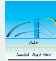
Jumeirah Beach Hotel, 7 Sterne Jumeirah Beach Hotel, 7 Stars Jumeirah Beach Hotel, 7 Etoiles