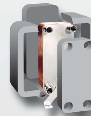
Diffusionsdichte Isolierungen Diffusion resistant sealed insulation material Isolations étanches à la diffusion.