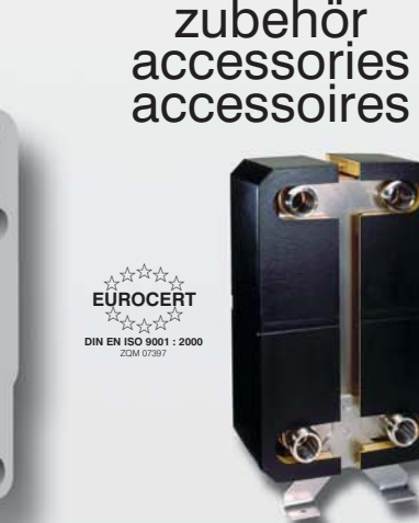
Isolierungen aus PU Hartschaum Insulation with PU hardened foam material Isolations en mousse polyuréthane dure

Das Unternehmen WTT WTT entwickelt, produziert und vermarktet gelötete Plattenwärmeübertrager. Gegründet wurde das Unternehmen 1992. Der Name WTT ist weltweit zu einem Begriff für gelötete Plattenwärmeübertrager hoher Qualität geworden. Die Fertigung erfolgt nach dem Qualitätsmanagementsystem DIN EN ISO 9001 : 2000. Besuchen Sie uns im Internet http://www.WTTglobal.com Sales@WTTglobal.de