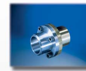
Aufschraubflansch DN 25 DN 25 screw threaded coupling flange Brides de raccordement DN 25