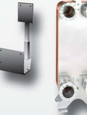
Plattenwärmeübertrager mit Konsole BK79 und Transporthaken TH79 Plate heat exchanger with BK79 console and TH79 transportation brackets. Echangeurs avec console BK79 et crochet de transport TH79