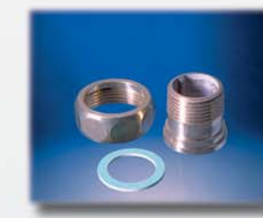
Anschlußverschraubungen Connecting screw jointed unions Raccordements