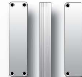
1/2" Innengewindestutzen zur Temperaturüberwachung 1/2 inch internal screw threaded connector piece for temperature monitoring Pices 1/2 pour controle de température Boden - Wand - Konsole BWK35 BWK35 bottom panel console Console sol/mur BWK35