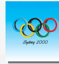
Olympiaanlagen Buildings for the Olympic Games Parc Olympique