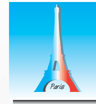
Restaurant im Eiffelturm Restaurant in the Eiffel Tower Restaurant de la Tour Eiffel

Deutschland Technische Universität Dresden Audi Werke Ingolstadt Hauptbahnhof Leipzig Germany Technical University Dresden Audi - car plant Ingolstadt Railway Station Leipzig Allemagne Université Technique de Dresde Usines Audi à Ingolstadt Gare centrale de Leipzig