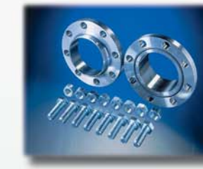
Flanschverbindungen Flange connections Brides